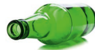
bottiglia di vetro