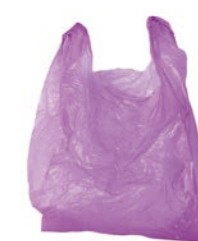
sacchetto di plastica