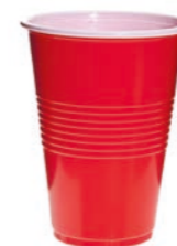
bicchiere di plastica