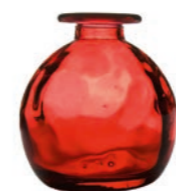
vaso di vetro